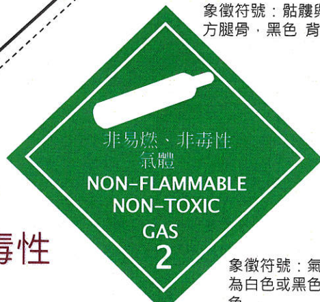
象徵符號：氣體鋼瓶，得 為白色或黑色 背景：綠 色