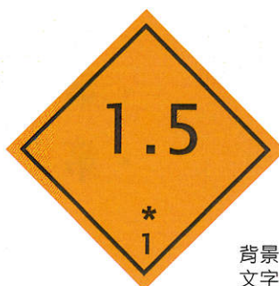
背景：橙色 文字：黑色