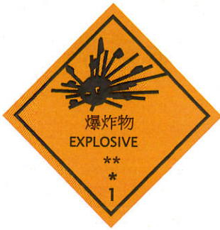
象徵符號：炸彈爆炸， 黑色 背景：橙色