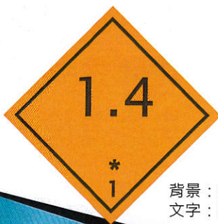
背景：橙色 文字：黑色