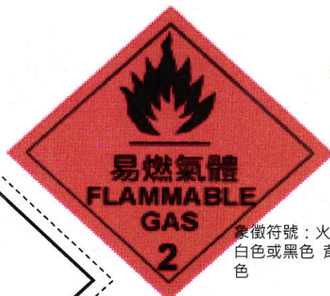
象徵符號：火焰，得為 白色或黑色 背景：紅 色