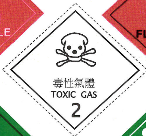
象徵符號：骷髏與兩根交叉 方腿骨，黑色 背景：白色